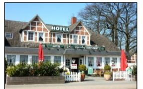
Hotel zum Meierhof Buxtehuder Str. 3