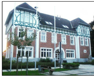
Rathaus, Schützenstr. 24