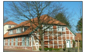
Heimathaus Himmelsweg 8