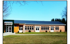
Schützenhalle/ -Platz Schützenstraße