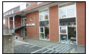
Bücherei Schützenstr. 26 a