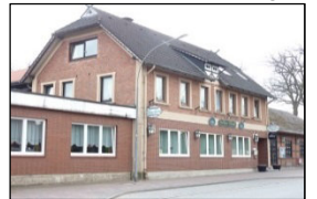
Hotel und Gasthaus Wiechern, Tostedter Str. 9