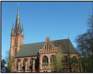
Johanneskirche, Himmelsweg 6